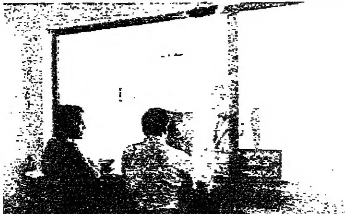
مؤتمرون يسمعون مناقشتها

صيدا - من مراسل «الأخبار» : ارسلت محافظة الجنوب بشرات خطية الى بلديات المحافظة طلبت فيها اليوم انتداب موظف من كل بلدية لتسلم كميات البضائع المخصصة لكل بلدية لبدء العمل بردها بنسبة قريب حول فصل الصيف، حيث تكثرت الاضرار.